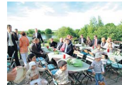
Mittelpunkt des Landhauses Panker ist die große Terrasse des Restaurants.

fordert zwei Caffe Latte vor uns. „Schön, dass ihr wieder da seid.“